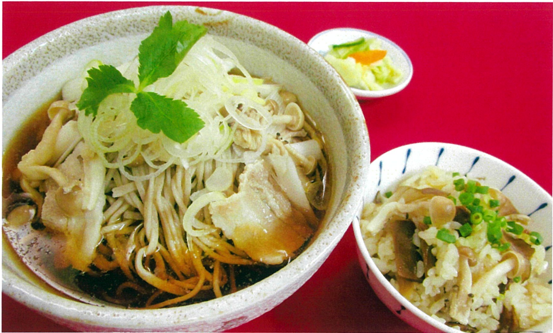
肉そばと炊き込みご飯