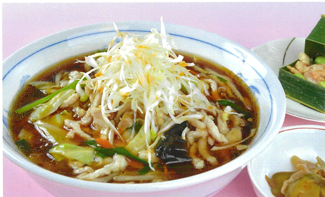
細切り肉のあんかけラーメン

黒酢の酸味、豆板醤の辛味、スイートチリの甘みをみじん切りにし、長葱を合わせたソースです。