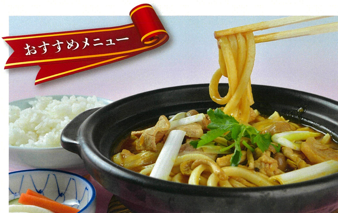
手延べ勝り鍋焼カレーうどん 【祇園原了郭 黒七味付き】