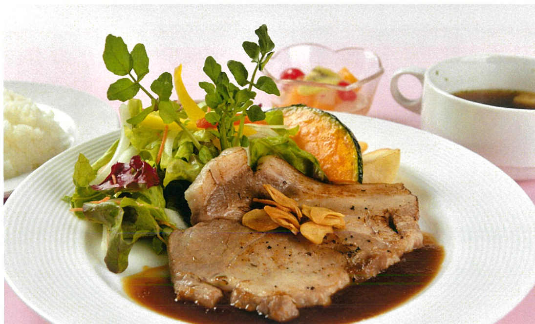
せせらぎ豚のグリル

(ライス・小鉢・香の物付) 圧倒的なしなやかさと艶の「手延べ勝り」うどんを自家製そばつゆとカレールーをブレンドしたつゆでご賞味下さい!