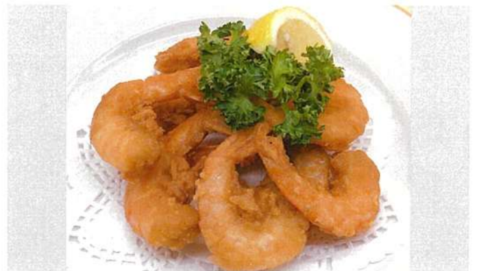
ガーリックシュリンプ