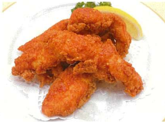
ピリ辛ささみスティック