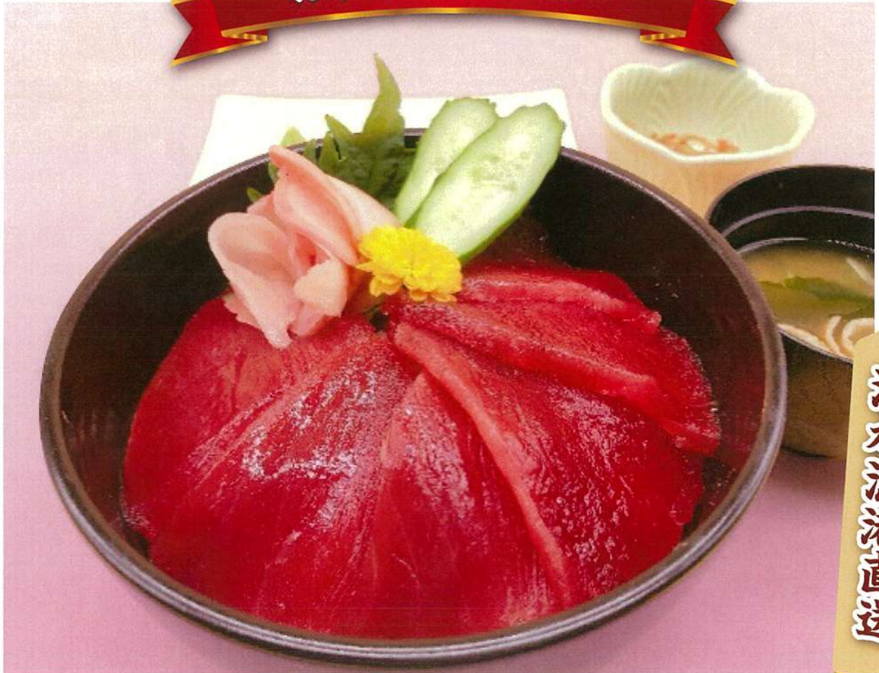
天然ミナミ鮪の鉄火丼 (味噌汁・小鉢付)