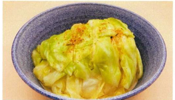
ハルピンキャベツ