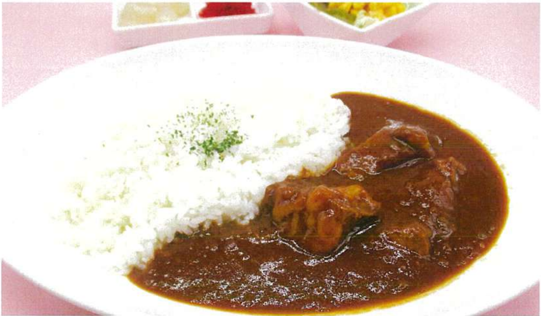
特製ビーフカレー (香の物・サラダ付)

群馬県産上州せせらぎ豚ロース使用 ピリッとした辛みがせせらぎ豚の柔らかさ&美味しさを更に引きたてます。