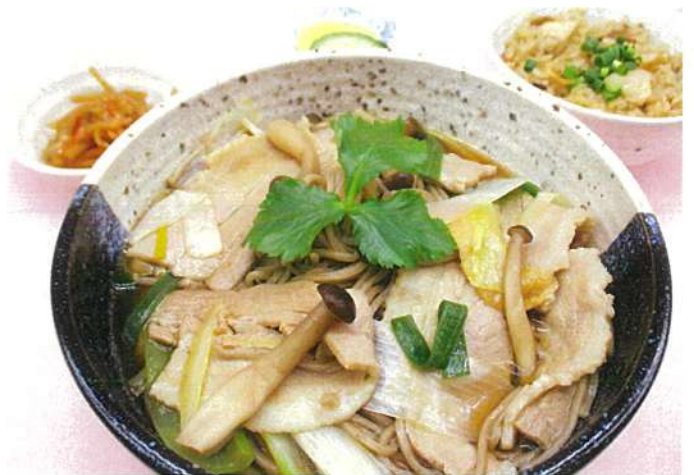
豚肉南蛮そば & 炊き込みご飯 (小鉢・香の物付)