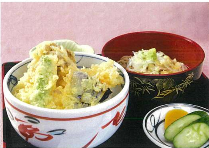
野菜天丼と半そば (温も可) (味噌汁・香の物付)

白、赤味噌に、ニンニク辛味噌をブレンドしたこくのあるスープに 野菜とチャーシューを入れたボリューム満点の一品です。