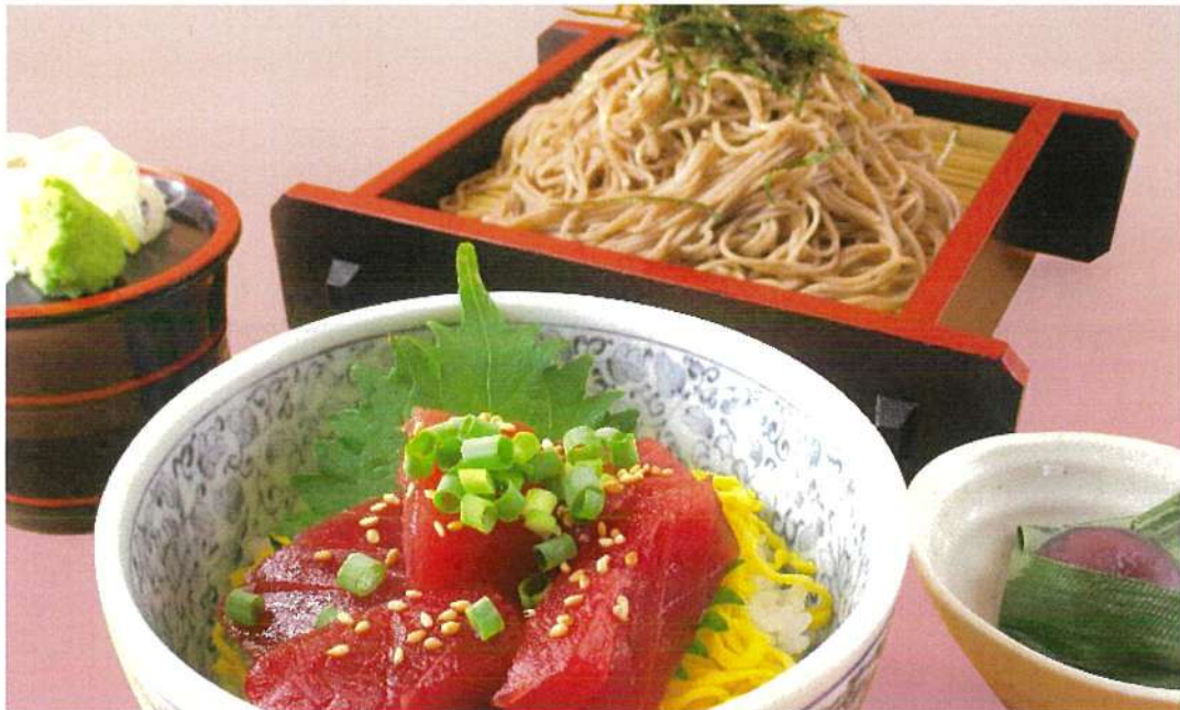
ざるそばとミニマグロ丼のセット ★うどんにも出来ます。

群馬県産せせらぎ豚の肉質は、脂身が甘く肉質が柔らかな食感です。 ジューシーで奥行き旨味をぜひ、ご賞味下さい。