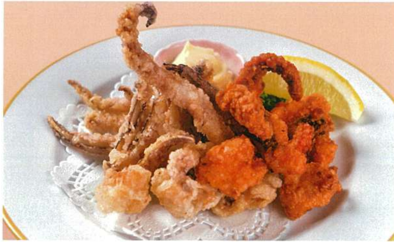
イカゲソ&タコ唐揚げ