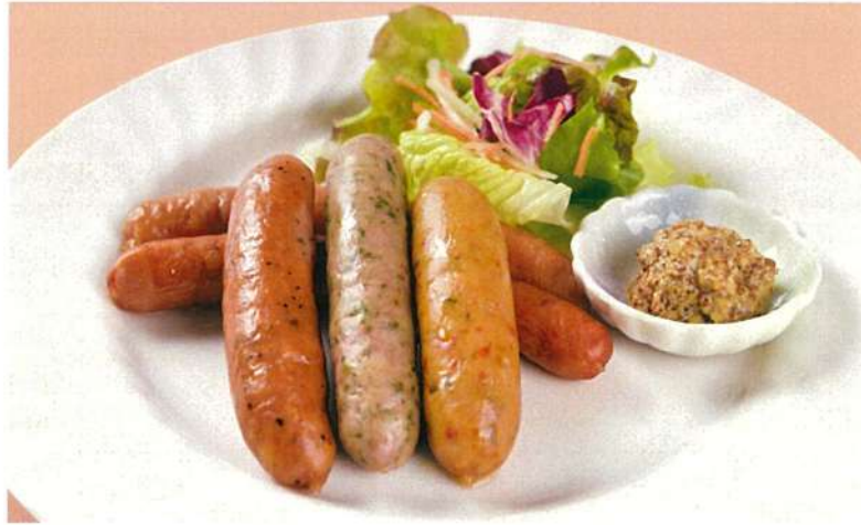
ビアソーセージ盛り合わせ