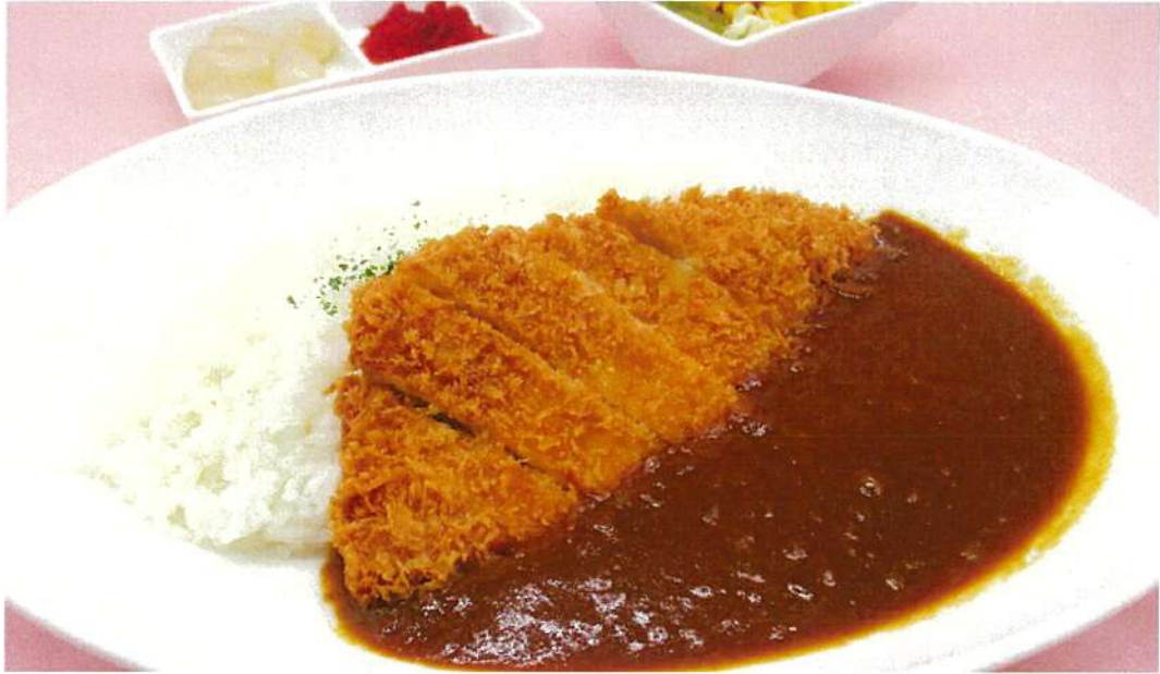
せせらぎ豚のカツカレー (香の物・サラダ付)