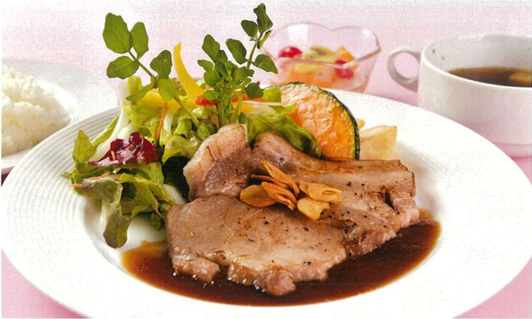
せせらぎ豚のグリル (ライス・スープ・サラダ・デザート付)