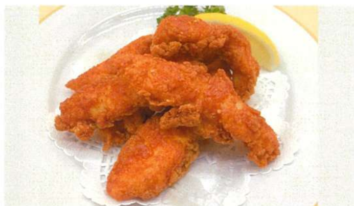
ピリ辛ささみスティック