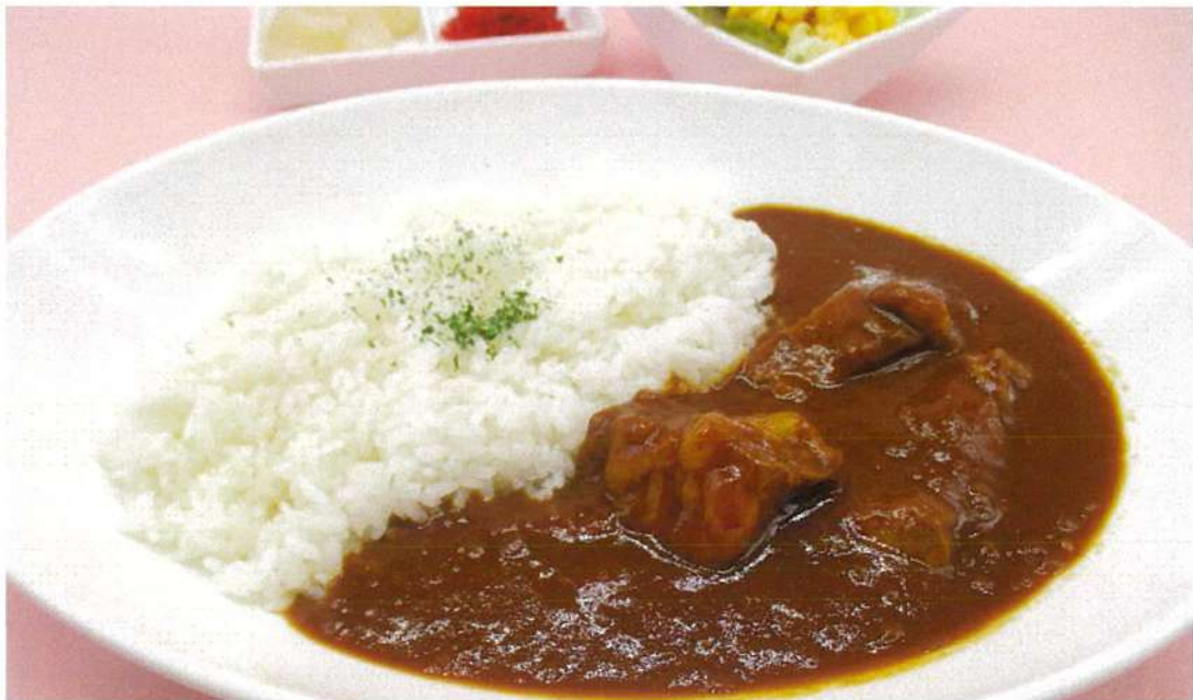
特製ビーフカレー (香の物・サラダ付)

群馬県産上州せせらぎ豚ロース使用 ピリッとした辛みがせせらぎ豚の柔らかさ&美味しさを更に引きたてます。