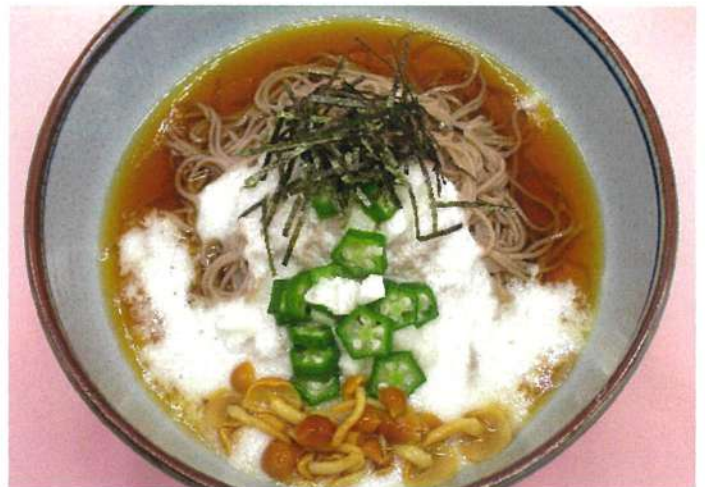
なめことろろそば (炊き込みご飯付)