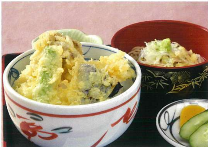
野菜天丼と半そば(温も可) (味噌汁・香の物付)