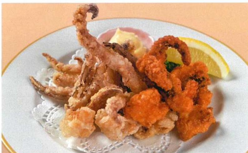
イカゲソ&タコ唐揚げ