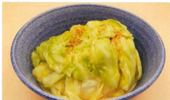
ハルピンキャベツ