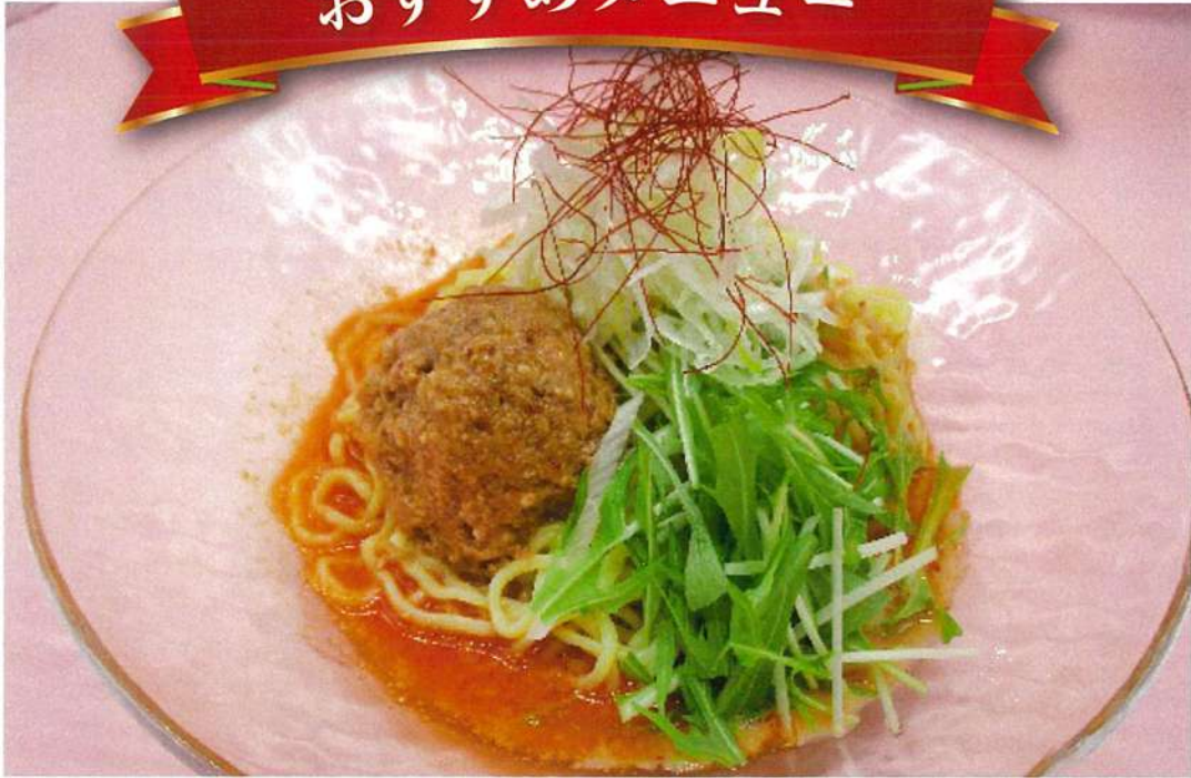
冷し担々麺 (焼売・デザート付)