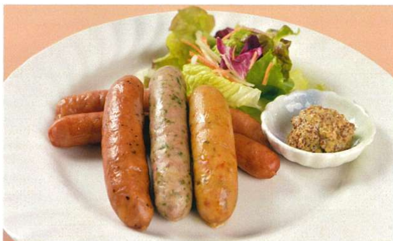
ビアソーセージ盛り合わせ