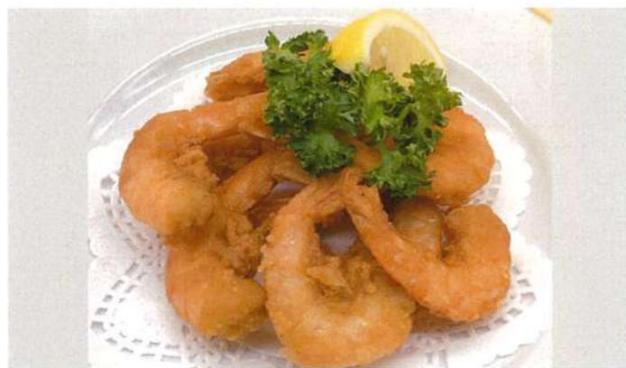
ガーリックシュリンプ