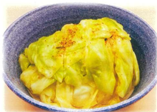
ハルピンキャベツ 740円