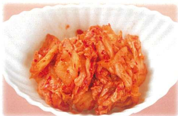
極旨 キムチ 590円