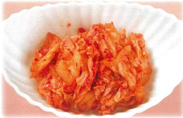
極旨 キムチ 590円