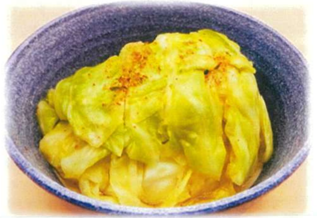
ハルピンキャベツ 740円