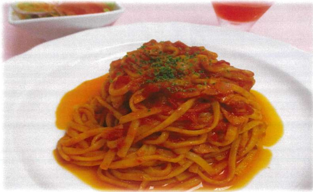
茄子とベーコンのポモドーロ