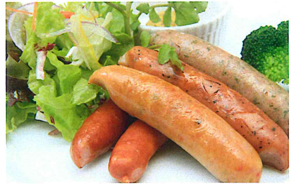
(ビア)ソーセージ盛り合わせ 680円