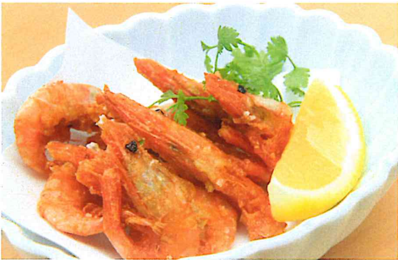
甘海老の唐揚げ 480円