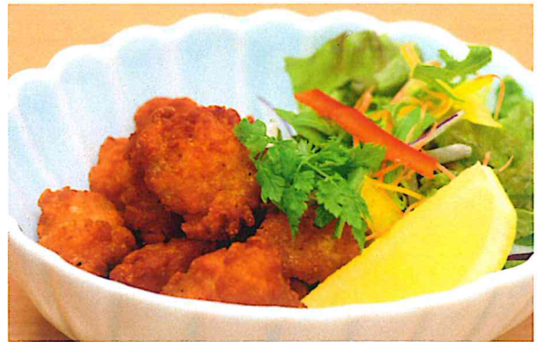
鶏軟骨の唐揚げ 550円