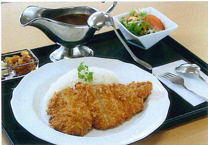
やまと豚のカツカレー

旨まぐろの食感と味わいを存分に堪能していただける、 美味しさあふれるネギトロに仕上げました。 (味噌汁・香の物・デザート付)