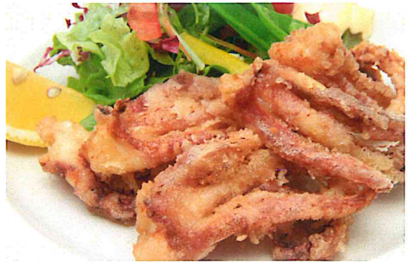
いかげそ唐揚げ 550円