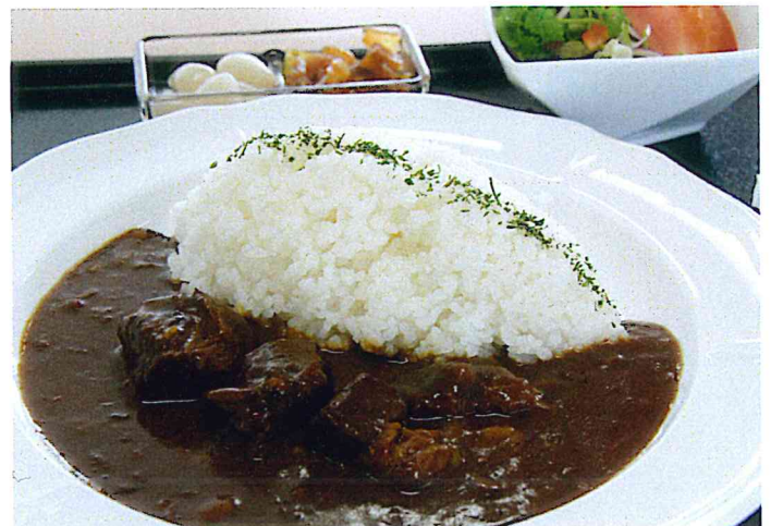
欧風ビーフカレー

欧風カレー独特の甘味の中から押し寄せる、 ピリッとした辛味が、やまと豚の美味しさを更に引き立てます。 (福神漬け・らっきょう・サラダ付)