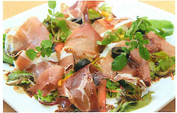
イタリアン生ハムサラダ 680円