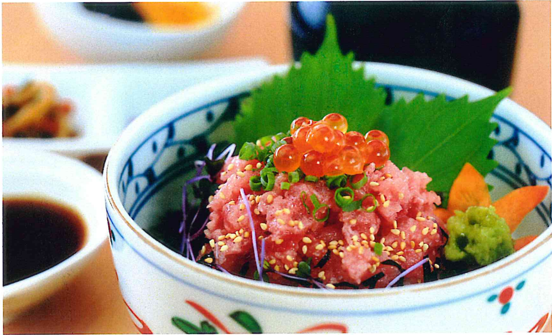
まぐろネギトロ丼