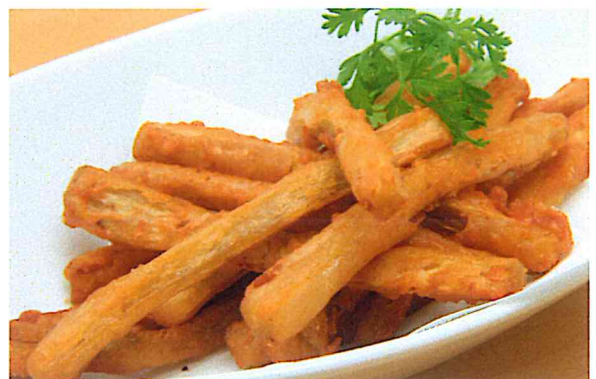
ごぼうの唐揚げ 550円