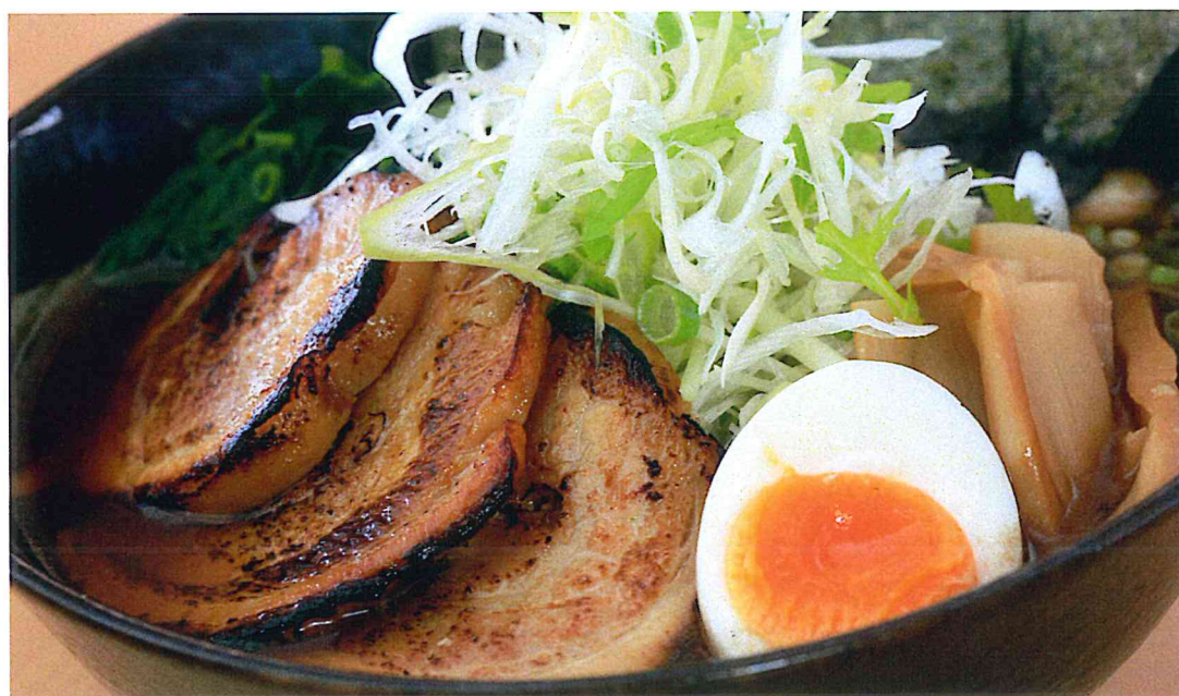
炙りチャーシュー麺

人気の「鴨せいろ」。肉質が柔らかく、香りも良い合鴨のロース肉を使用。 鉄鍋で野菜と共に焼き、お好みの焼き加減でつゆに漬けてお召上がりください。