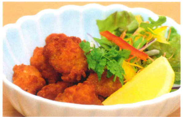
鶏軟骨の唐揚げ 550円