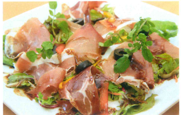
イタリアン生ハムサラダ 680円