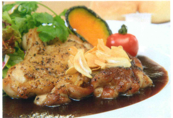
麦風地鶏のガーリックステーキ 1,200円

特製ソースで仕上げた「大人の味」!! 生姜の効いた、ご飯に良く合うポークジンジャーです。 (ライス・スープ・サラダ・デザート付)