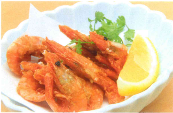
甘海老の唐揚げ 480円