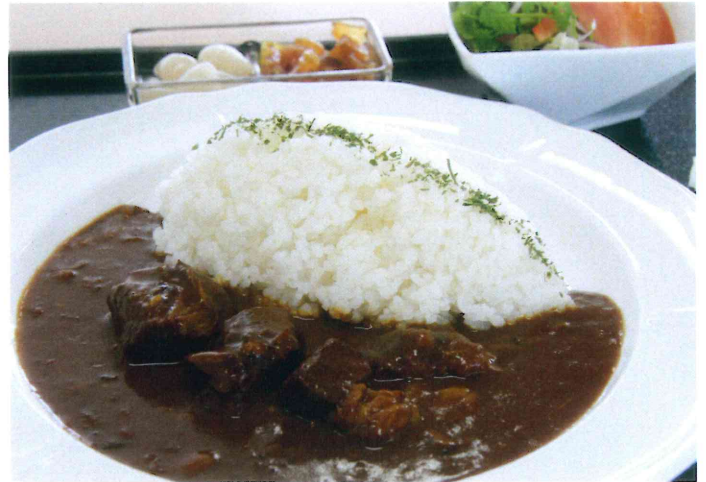
欧風ビーフカレー

欧風カレー独特の甘味の中から押し寄せる、 ピリッとした辛味が、やまと豚の美味しさを更に引き立てます。 (福神漬け・らっきょう・サラダ付)