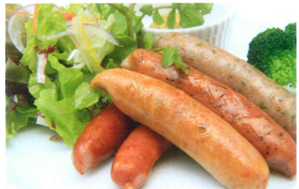
(ビア)ソーセージ盛り合わせ 680円