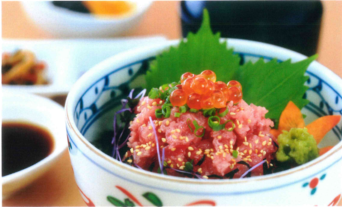
まぐろネギトロ丼