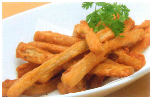
ごぼうの唐揚げ 550円