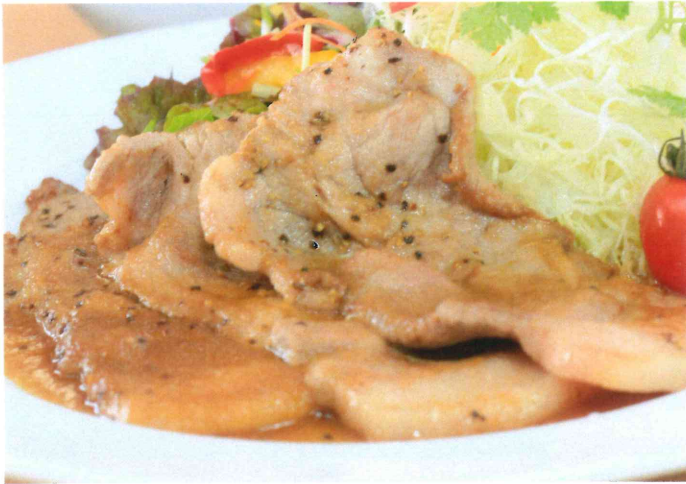
ポークジンジャー

旨味と辛味、野菜のバランスが絶品です。よく混ぜてお召し上がり下さい。 (スープ・デザート付)