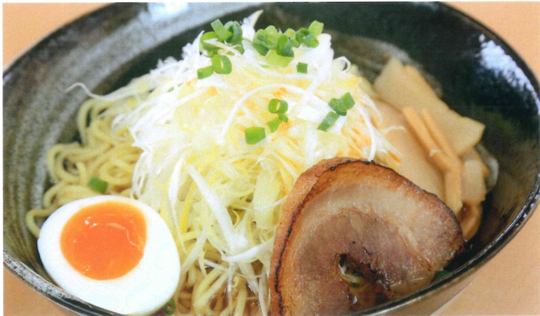
深谷ねぎ味噌ラーメン【秩父味噌使用】

人気の「鴨せいろ」。肉質が柔らかく、香りも良い合鴨のロース肉を使用。鉄鍋で野菜と共に焼き、お好みの焼き加減でつゆに漬けてお召上がりください。