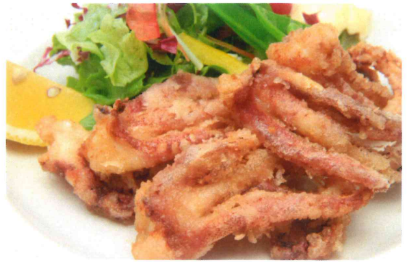
いかげそ唐揚げ 550円