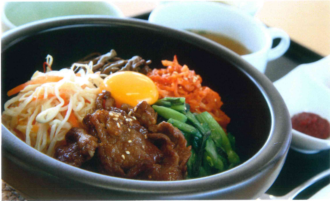
牛カルビ石焼ビビンバ